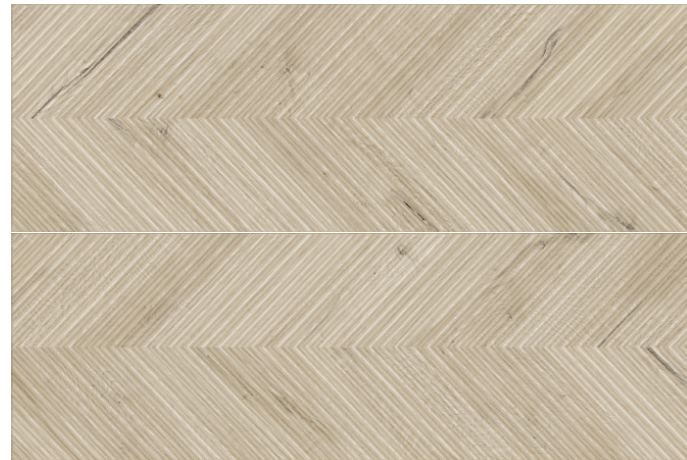
divedro cream chevron 30x90/12"x36" rectified 5903943502516