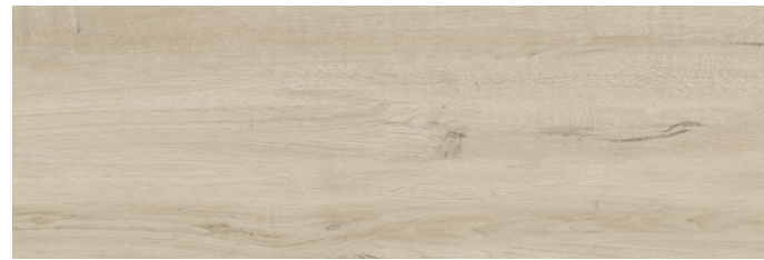
divedro cream 30x90/12"x36" rectified 5903943502493