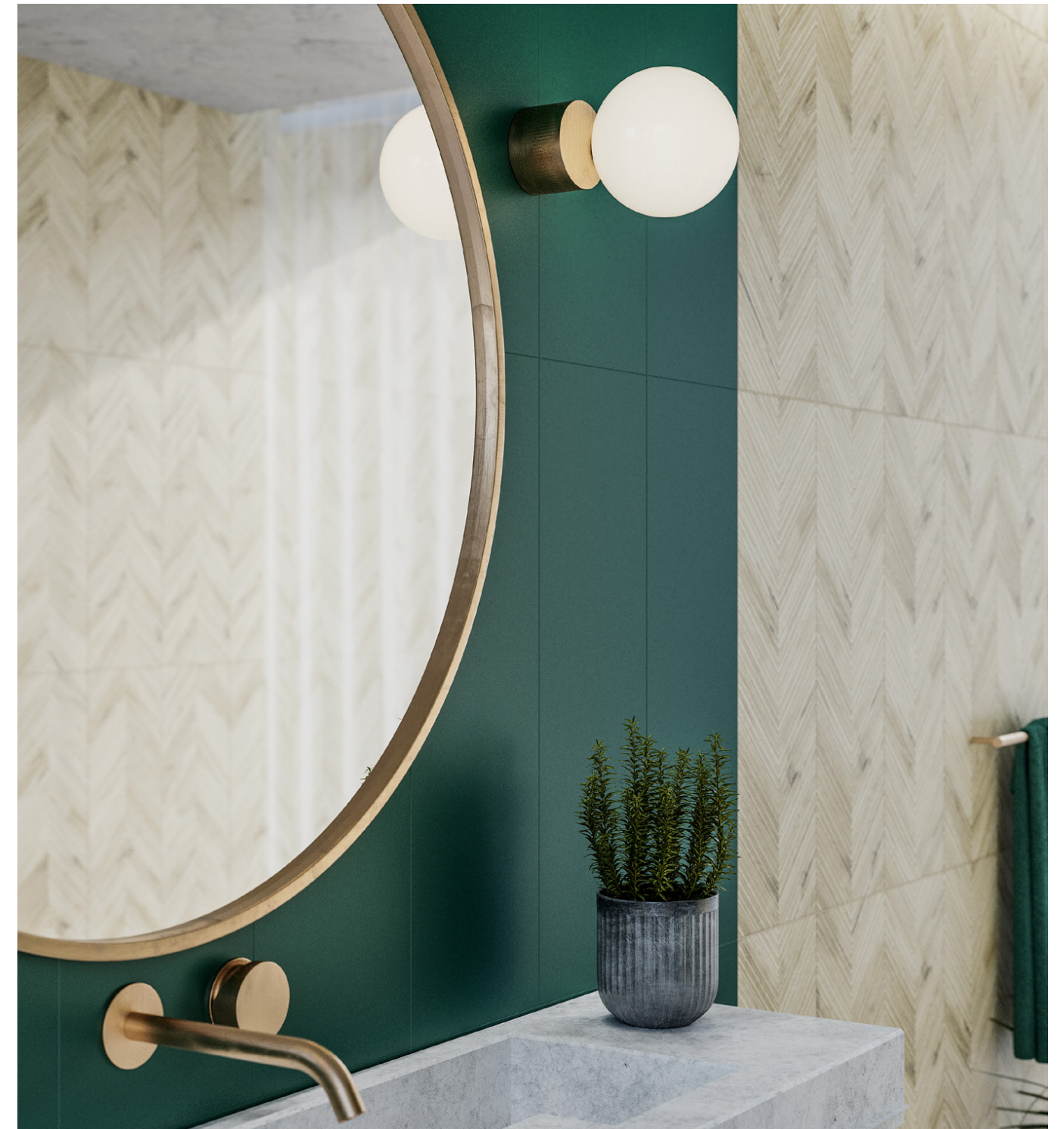
deep green/divedro cream chevron 30x90/12"x36" /rectified/